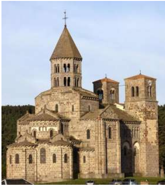
I группа иллюстраций