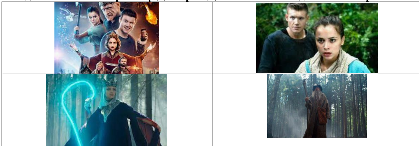
Таблица для ответа:

Создайте логлайн к фильму Дмитрия Дьяченко «Последний богатырь».