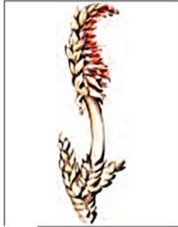
2 Петров крест – растение, лишённое хлорофилла