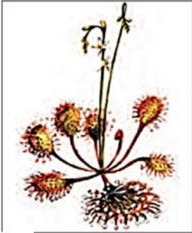
1 Росянка – растение, которое охотится на насекомых

2. Рассмотрите изображенные объекты. Объясните, что общего между ними.